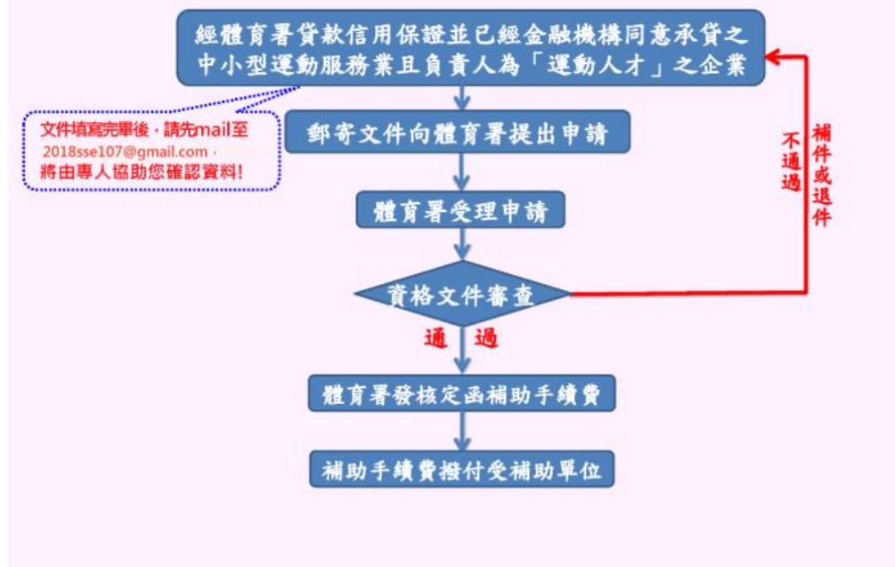
圖 2 貸款信用保證手續費補助申請流程