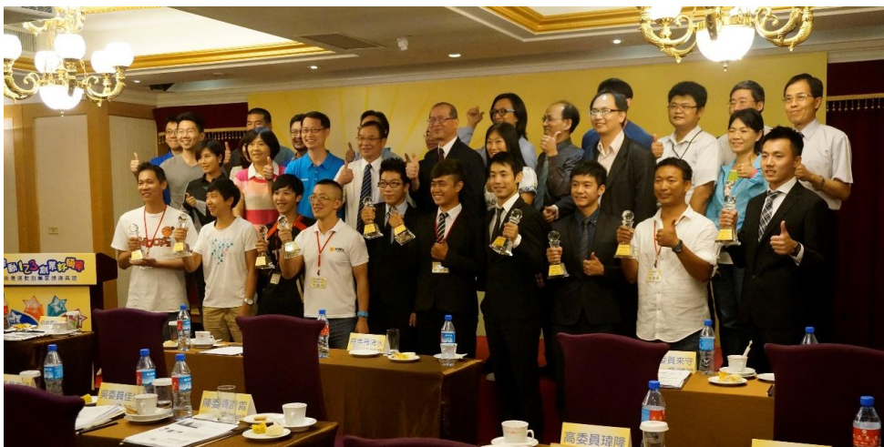
圖 1 第一屆「我是運動創業家」獲獎團隊合照

教育部體育署於 2011 年公佈『運動產業發展條例』，該條例自 2012 年 3 月 1 日生效。『運動產業發展條例』的其中一項目標就是為了扶植臺灣運動領域並且創造更優質的商業環境。然而，為了實踐此目標，體育署在 2015 年推出了運動服務業創新創業輔導計畫。在此計畫下，體育署同樣以辦理創業競賽（以下稱為我是運動創業家）作為其中一項鼓勵民眾創業的策略（圖 1 為第一屆我是運動創業家決賽得獎隊伍合照）。此創業輔導計畫所涵蓋的產業別包括：運動場館業、運動表演業、職業運動業、運動休閒教育服務業、有運動保健業、運動行政管理服務業、運動傳播媒體業、運動資訊出版業及運動旅遊業。